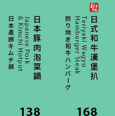
168 お母 日式和牛漢堡扒 Teriyaki Wagyu Hamburger Steak 照り焼き和牛ハンバーグ