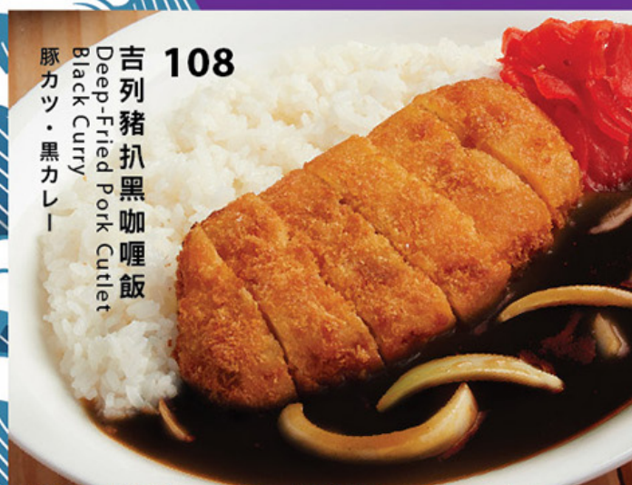
108 吉列豬扒黑咖喱飯 Deep-Fried Pork Cutlet Black Curry 豚カツ・黒カレー