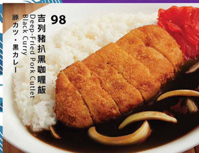
98 吉列豬扒黑咖喱飯 Deep-Fried Pork Cutlet Black Curry 豚カツ・黒カレー