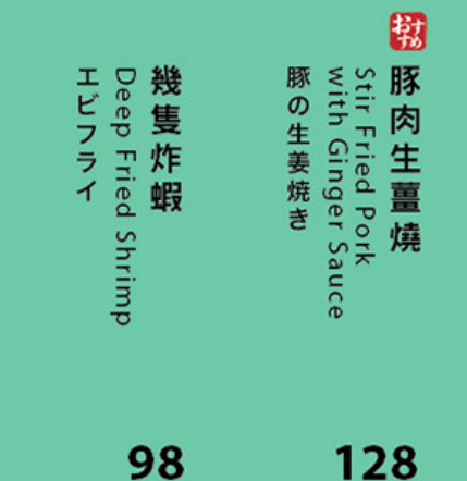
98 幾隻炸蝦 Deep Fried Shrimp ヒュンライ 128 お母 豚肉生薑燒 Stir Fried Pork with Ginger Sauce 豚の生姜焼き