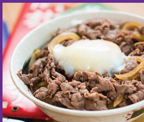
溫泉蛋牛肉丼 Beef Don With Onsen Egg 溫泉卵・牛丼