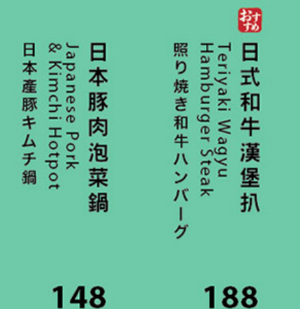
148 日本豚肉泡菜鍋 Japanese Pork & Kimchi Hotpot 日本産豚キムチ鍋 188 お母 日式和牛漢堡扒 Teriyaki Wagyu Hamburger Steak 照り焼き和牛ハンバーグ