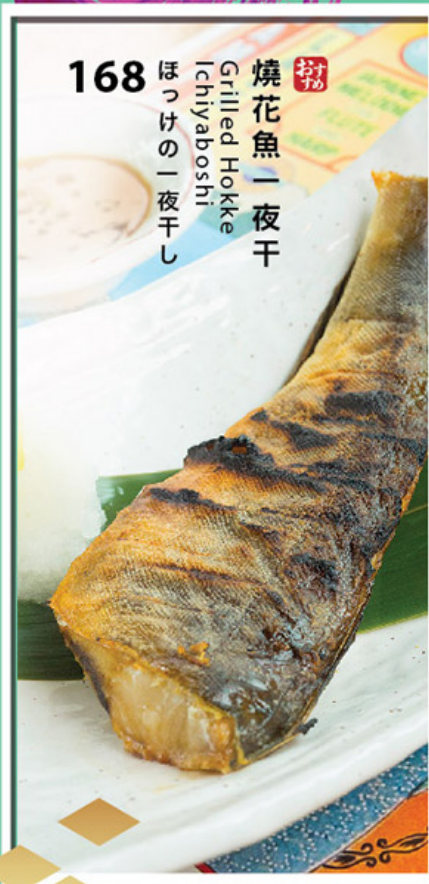
168 お母 焼花魚一夜干 Gilled Hokke Ichiyaboshi ほっけの一夜干し