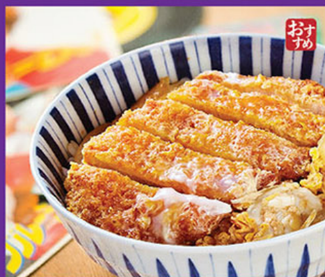
おま 滑蛋豬太郎丼 Katsu Don カツ丼