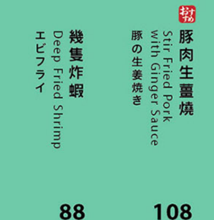
88 幾隻炸蝦 Deep Fried Shrimp エビフライ