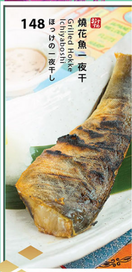
148 お母 焼花魚一夜干 Gilled Hokke Ichiyaboshi ほっけの一夜干し