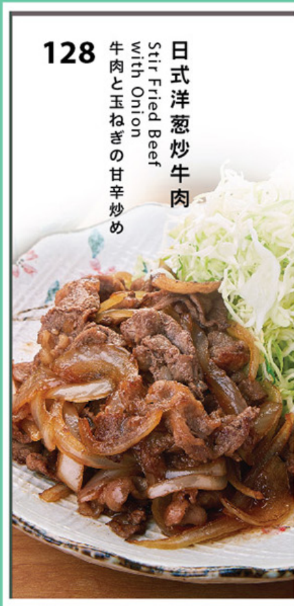
128 日式洋葱炒牛肉 Stir Fried Beef with Onion 牛肉と玉ねぎの甘辛炒め