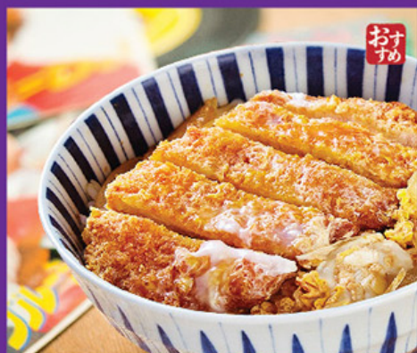
おま 滑蛋豬太郎丼 カツ丼 Katsu Don