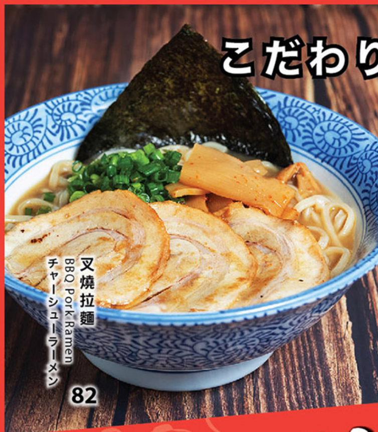
又焼拉麵 BBQ Pork Ramen チャーシューラーメン