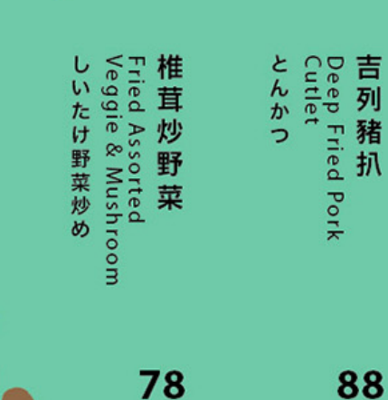
78 椎茸炒野菜 Fried Assorted Veggie & Mushroom しいたけ野菜炒め 88 吉列猪扒 Deep Fried Pork Cutlet とんかつ