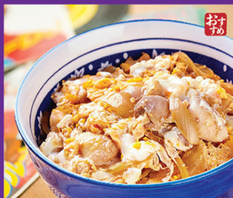
おま 闔家丼 親子丼 Chicken and Egg Don