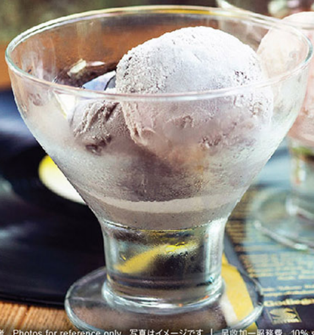
雪糕 (黑芝麻 / 抹茶 / 雲呢拿) Ice-cream Selection (Black Sesame / Matcha / Vanilla) アイスクリーム各種 (黒ゴマ / 抹茶 / バニラ)