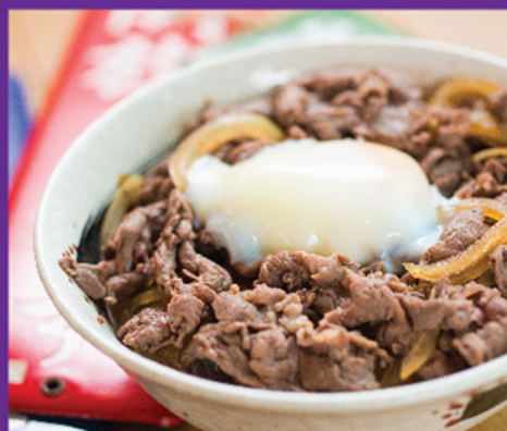
溫泉蛋牛肉丼 Beef Don With Onsen Egg 溫泉卵・牛丼