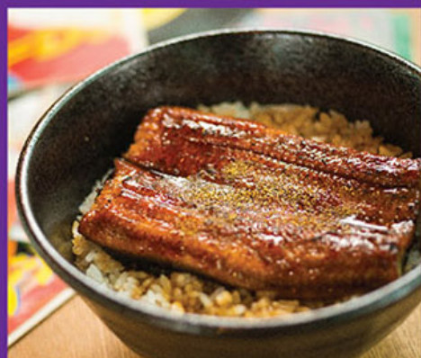
鰻魚飯 Una Don 鱈丼